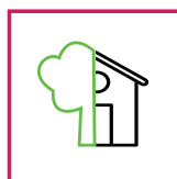
Exterior / Interior